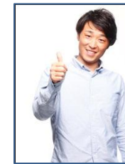
店長によるヘアカット3回分