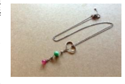
翡翠のペンダント