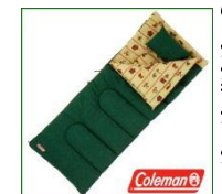
コットンスリッパ