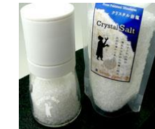
ソルト&ヤ塩専用ミル