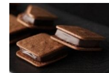
訳ありのアイスサンド