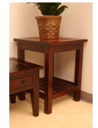
マホガニー材のテーブルと椅子