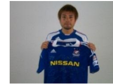
横浜フューチャーズのユニフォーム