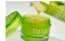
エラスチン配合のクリーム